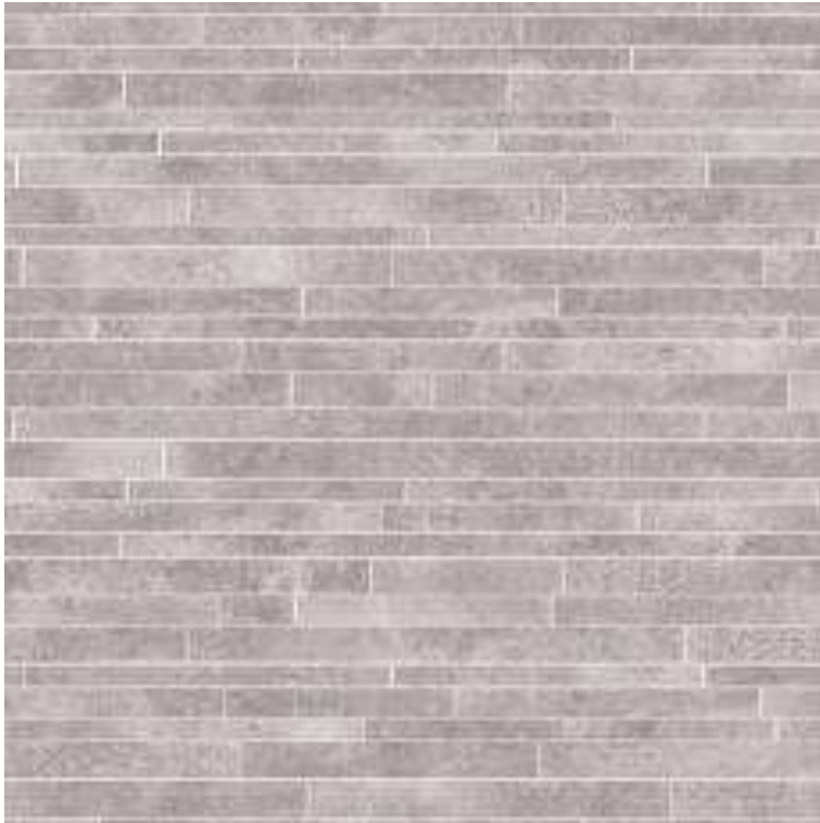
Tarkett Aquarell Wall 3955072 szary.