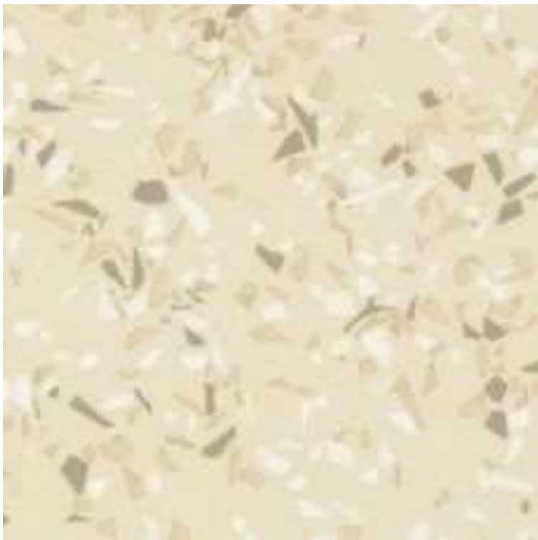
Salt&Pepper 4608 007