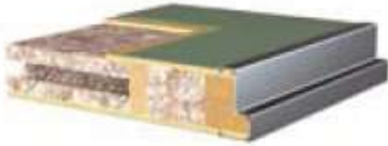
plyta wiórowa otworowa (ENDURO)

Drzwi w kolorze zielonym, dodatkowo wyposażone w panel górny oraz dolny (dla wzmocnienia przed uderzeniami kółek łóżek i wózków), oraz panel wentylacyjny w przypadku drzwi do łazienek.