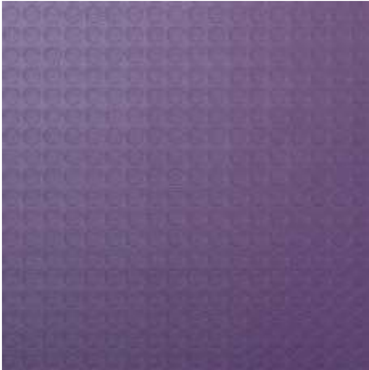
Tarkett Aquarell Floor kolor Turkus