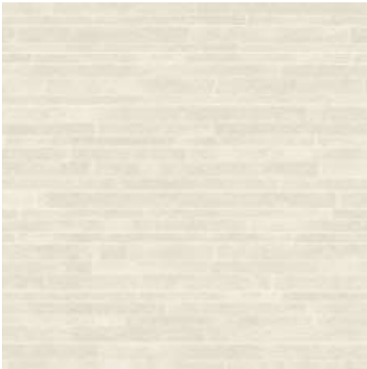
Tarkett Aquarell 3935074

Ściany - malowane dwukrotnie farbą lateksową - kolor biały. Miejscowo stosować wykładzinę pcv typu - wykładzina Tarkett Aquarell 3935074, lub inna równoważna w identycznym kolorze za umywalką. W miejscach zagrożonych obtarciami (za fotelami na kółkach, kozetkami) stosować również pasy z Tarkett Aquarell w kolorze ścian (białym)